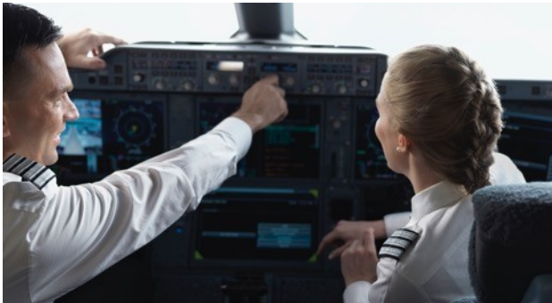
Koneiden ja miehistön ulosvuokraukset