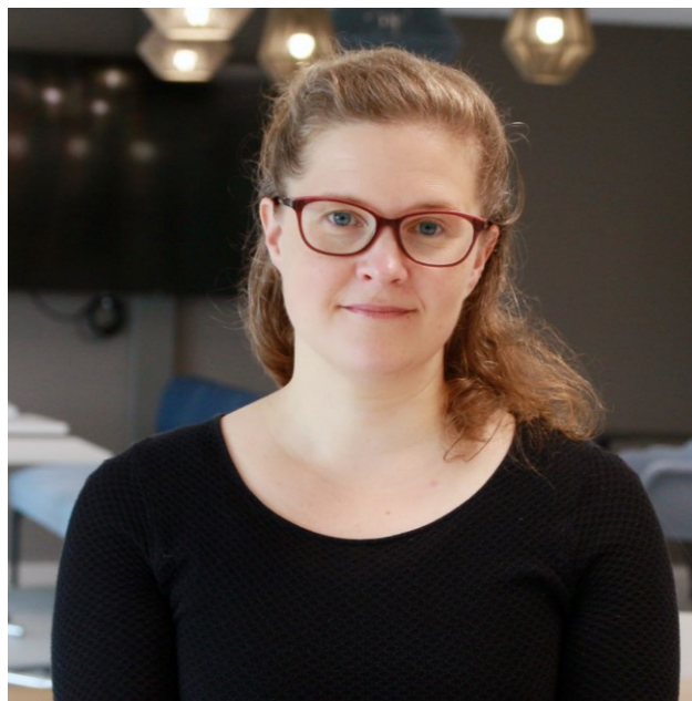
Opetusneuvos Riikka Koivusalo Opetushallituksesta